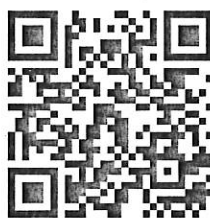
(แบบประเมินหลัง)

๑๐. ขอให้ผู้เข้าสอบทุกคน ทำแบบสอบถามเพื่อประเมินผลการป้องกันการแพร่ระบาดของโรคติดเชื้อไวรัสโคโรนา 2019 (COVID-19) ภายหลังจากเข้ารับการประเมินสมรรถนะ(สอบข้อเขียน) ไปแล้ว โดยให้สแกน QR Code หรือเข้าไปที่ https://forms.gle/H3Hu6jzeDr5AZgT46 โดยสามารถตอบแบบสอบถามได้ตั้งแต่วันที่ ๑๑ - ๑๕ สิงหาคม ๒๕๖๔ เพื่อการติดตามผลและป้องกันการแพร่ระบาดของโรคติดเชื้อไวรัสโคโรนา 2019 (COVID-19)